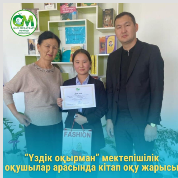
“Үздік оқырман” мектепшілік оқушылар арасында кітап оқу жарысы